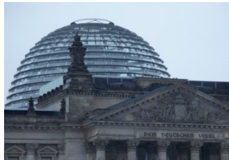
Berliner Reichstag

Mehrfachbesteuerung abschafft. Mit klaren Worten warnt der Verband zudem vor dem leichtfertigen Auftürmen weiterer Staatsschulden. Schließlich wird die Politik